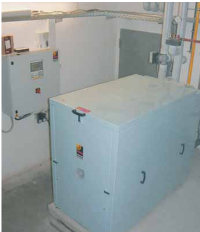
Cogeneratore a gas metano da 30 kW, con cuffia insonorizzante e serbatoio di riserva da 2 m 3