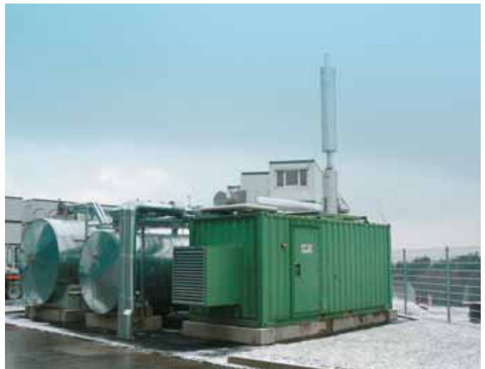
Cogeneratore a olio vegetale 150 kW Pin versione container con serbatoio da 35 m 3 e cisterna di riserva da 26 m 3

Per ulteriori informazioni scrivete a: info@wuerz.com