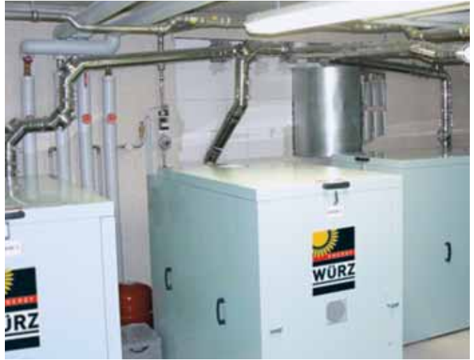
4 cogeneratori da 30 kW a gas metano con cuffia insonorizzante e 2 serbatoi di riserva da 5 m 3