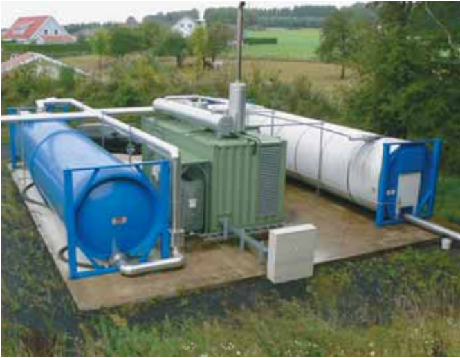
Cogeneratore a olio vegetale 340 kW in versione container con serbatoio da 50 m 3 e cisterna di riserva da 50 m 3