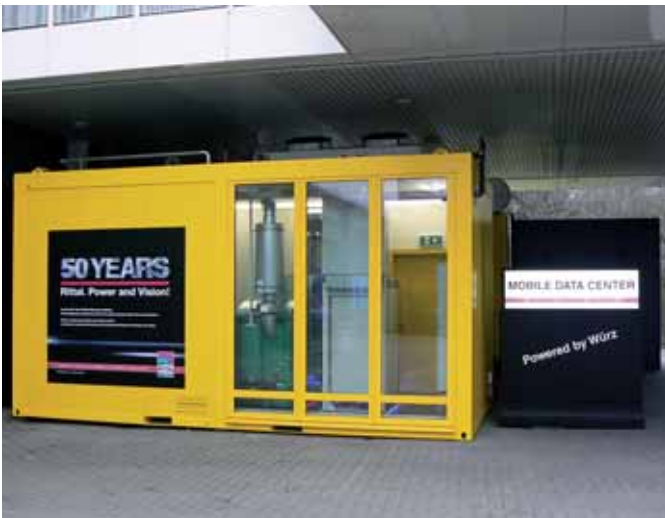
2 cogeneratori da 8 kW a olio vegetale con refrigeratore ad assorbimento da 10 kW, serbatoio combustibile da 750 litri e cisterna da 1.100 litri (accumulatore di calore) integrati nel container