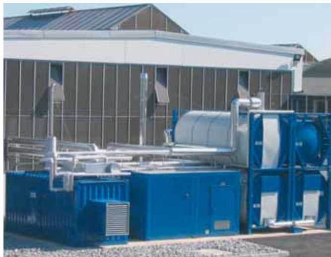
Cogeneratore a olio vegetale 120 kW in versione container con 2 serbatoi olio vegetale da 24 m 3 , riscaldatore olio combustibile con serbatoio per combustibile da 24 m 3 e cisterna di riserva da 24 m 3