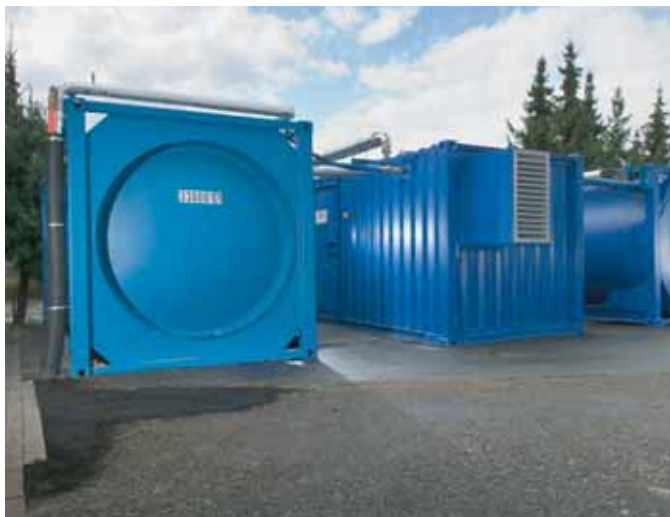
Cogeneratore a olio vegetale 90 kW in versione container con serbatoio e cisterna di riserva 25 m 3