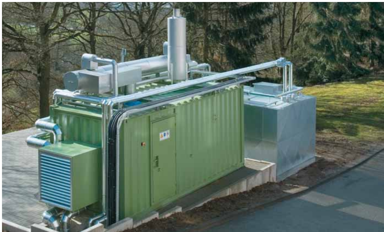
Rittal, impianto di Herborn, Germania: cogeneratore da 340 kW a olio vegetale, con serbatoio combustibile da 36 m 3 di Würz Energy