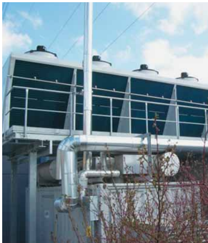
Cogeneratore da 340 kW in versione container con refrigeratore ad assorbimento da 220 kW, con serbatoio olio vegetale da 50 m 3 e due cisterne di riserva da 60 m 3 , una per il calore e una per il freddo